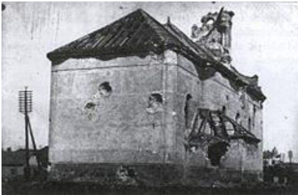
A szolnoki Vártemplom 1919-ben, a menekülő nyílással

Ebben az ostromállapotban a szolnoki Vártemplom tabernákulumában maradt az Oltáriszentség, míg a szentmisék már a ferences templomban folytak, a város némileg biztonságosabb felében. A Vártemplomot a lebombázás vagy a szétlövés veszélye fenyegette, maga az Oltáriszentség is megsemmisült volna. „Legjobban aggódnak és bántja a Pátereket, hogy a tabernákulumban ott maradt a monstrancia és a cibórium tele átváltoztatott partikuláréval. Nagyon bántaná őket, ha valami tiszteletlenség érné a Jézuskát. Ezt kellene valakinek – ha van rá mód – elhozni...Hiába panaszkodott a Páter, vállalkozó nem akadt, mert lehetetlen volt átjutni a várba...Ettől az időtől mindig csak azon gondolkoztam, hogyan menthetném meg a Jézuskát, hogy lássa, én szeretem őt!”[G.E. 2003. p. 17.]